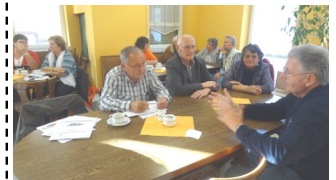
Beim letzten Treffen des Freundeskreises & der Patenern 2014 in Ober-Roden

Wie Ihr sehen könnt, sind wir auch dieses Jahr wieder aktiv und auf zahlreiche Spenden angewiesen und hoffen so auf Eure Unterstützung und Mithilfe!